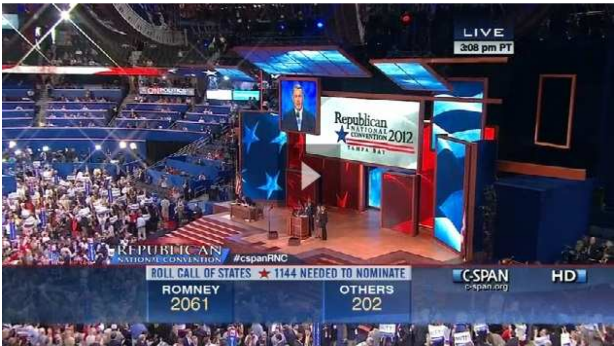
Výsledek hlasování Republikánské národní konvence 28. 8. 2012 v Tampě na Floridě: 2061 hlasů pro Mitta Romneyho a 202 hlasů pro další kandidáty (z toho 190 hlasů pro Rona Paula). Romney zvolen oficiálním republikánským presidentským kandidátem USA.

Mnoho se v poslední době debatovalo o tom, zda dostanu na Republikánské národní konvenci prostor ke svému projevu. Až dosud se tak nestalo a již jsem to pak pokládal za uzavřenou věc, nicméně dnes mi překvapivě volali z Republikánského národního výboru 27 (Diváci hučí.) a sdělili mi, že si to rozmysleli a změnili názor 28 . (Diváci opět hučí.) Že prý mi dají k dispozici pro můj projev celou hodinu a můžu si na Republikánské národní konvenci dokonce svobodně říkat to, co chci 29 . (Nadšení lidí.) Jenže až zítra večer 30 . (Potlesk, Ron Paul se směje.) Pouze žertuji. Pouze žertuji.