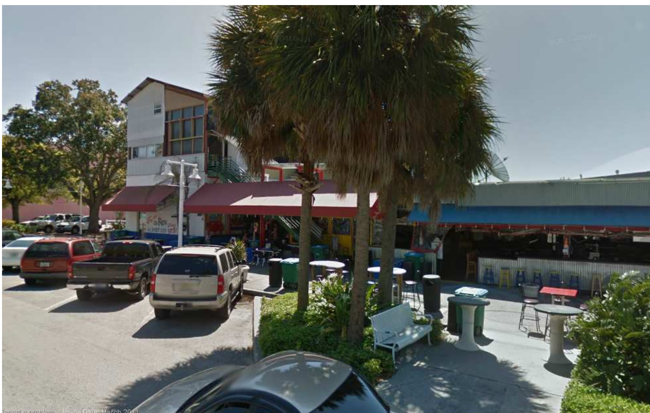
Místo konání „Liberty Rocks After Party“ ve „Fergsově sportovním baru a grilu“ v Tampě.

Máme tak příležitost všem ukázat, že to právě my představujeme budoucnost republikánské strany, takže bych rád požádal všechny své fanoušky, kteří nejsou delegáty a nebo náhradníky, aby zformovali podél příjezdových cest špalíry s transparenty, abychom tak připravili pro naše delegáty velkolepé „entrée“.