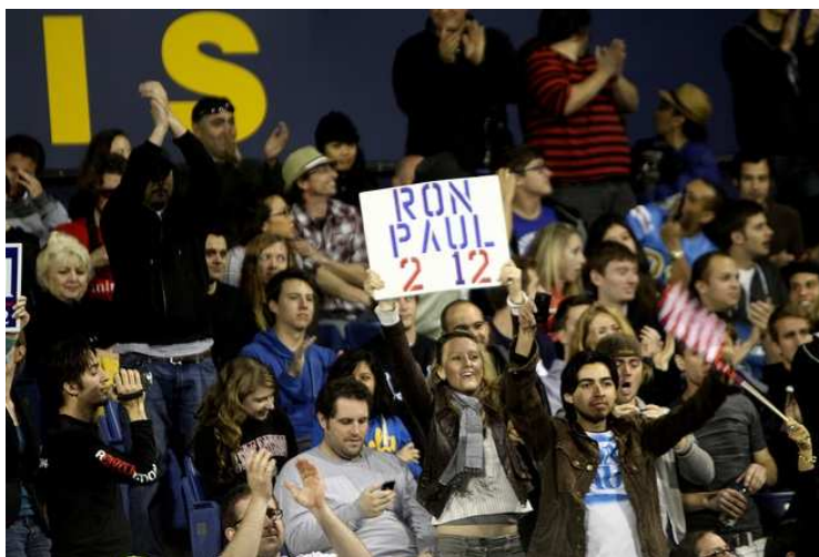
Fanoušci Rona Paula.