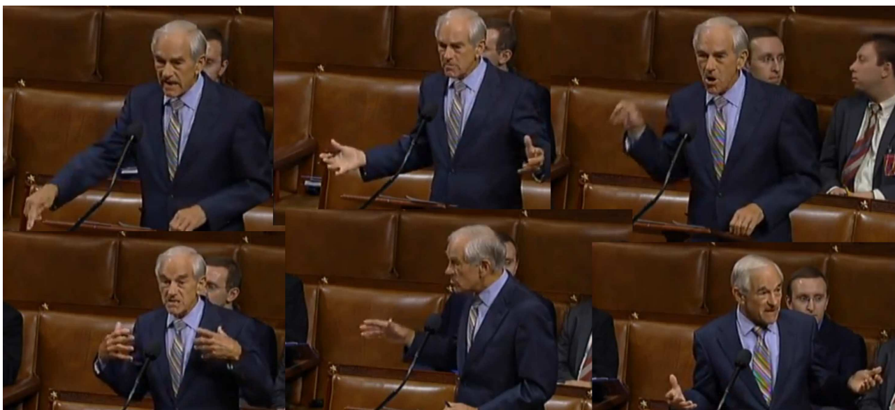
Dr. Ron Paul při své "ohnivé" antiválečné řeči v americkém Kongresu 1. srpna 2012.

Úvodní poznámka: Následující text je překladem dvou projevů (2X2,5 min.) z 1. srpna 2012, které přednesl Ron Paul 1 (americký republikánský 2 kongresman 3 z Texasu 4 , lékař, křesťan a nejvýznamnější osobnost ze současné generace otců zakladatelů celého hnutí svobody 5 ) v Kongresu 6 USA ve věci projednávání zákona 7 o nových sankcích vůči Íránu 8 a Sýrii 9 . Prostřednictvím Internetu 10 se pak jeho řeč dostala k široké veřejnosti. Dr.