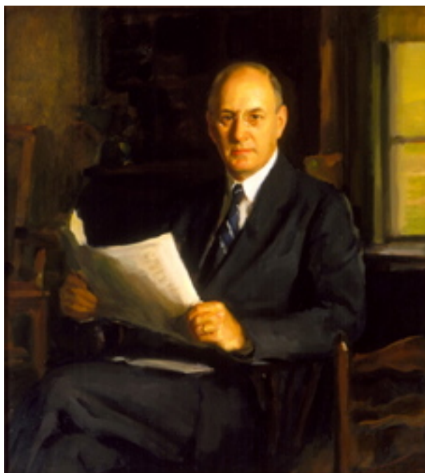
Henry Morgenthau, Jr.

Případným pánům daňovým zvyšovačům je třeba trochu osvěžit paměť. Pokud si někdo z nich ještě dnes myslí, že například Rooseveltův ( http://en.wikipedia.org/wiki/Franklin_D._Roosevelt ) New Deal ( http://en.wikipedia.org/wiki/New_Deal ) fungoval jako recept na Velkou ekonomickou krizi z 30. let 20. století ( http://en.wikipedia.org/wiki/Great_Depression ), pak by neměl zapomenout: jaké lidské tragédie ve skutečnosti způsobil, kolik soukromých firem zlikvidoval díky svým pokusům o regulaci trhu (dokonce zavírání podnikatelů za poskytnutí státem neschválené slevy z ceny zboží a služeb), kterak prodloužil lidské utrpení a že vyústil v potřebu nové války, druhé světové války ( http://en.wikipedia.org/wiki/Second_World_War ). Americký ministr financí v letech 1934-1945 jménem Henry Morgenthau ( http://en.wikipedia.org/wiki/Henry_Morgenthau,_Jr. ) tvrdě zkritizoval roku 1939 doposud provedené Rooseveltovy reformy a neviděl do budoucna jakoukoliv naději na zlepšení stavu amerického hospodářství.