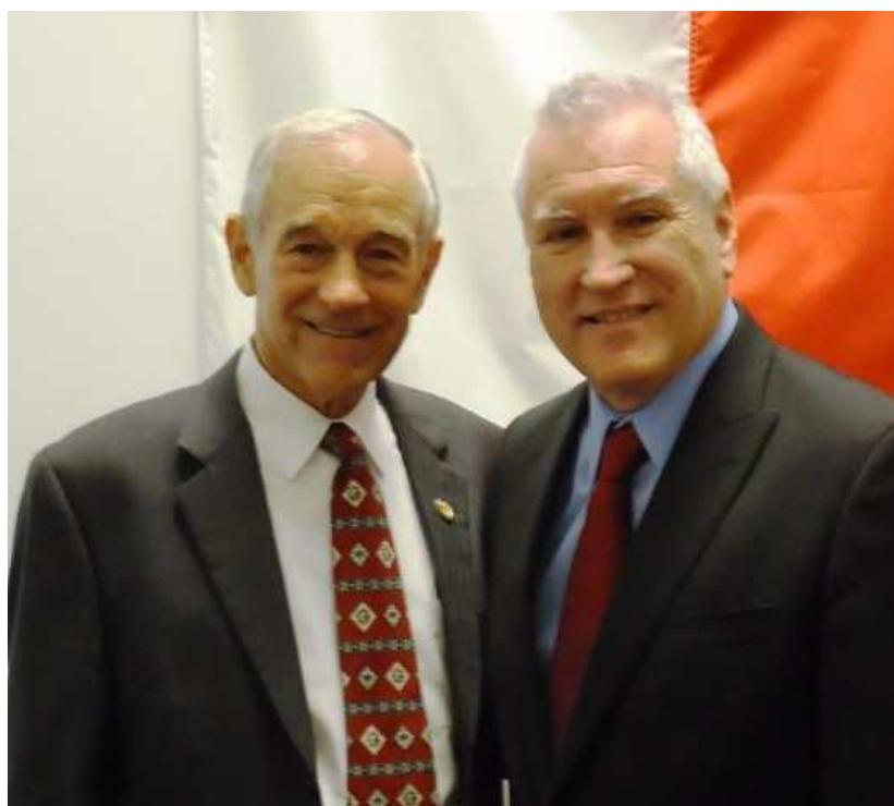
Ron Paul a Doug Wead.