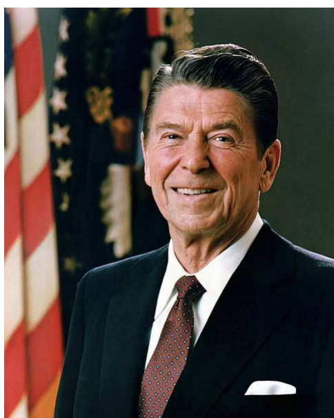
Ronald Wilson Reagan - president USA v letech 1981 - 1989.

Úvodní poznámka: Článek představuje upravenou verzi původního autorova textu z června 2009 1 . Popisuje životní příběh a osobnost amerického presidenta Reagana 2 se zaměřením na silné křesťanské poselství tohoto politika a jeho význam pro každodenní boj s beznadějí a krizemi všeho druhu.